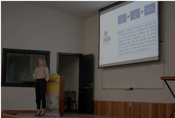
Palestra “Repercussões jurídicas do tráfico de animais”