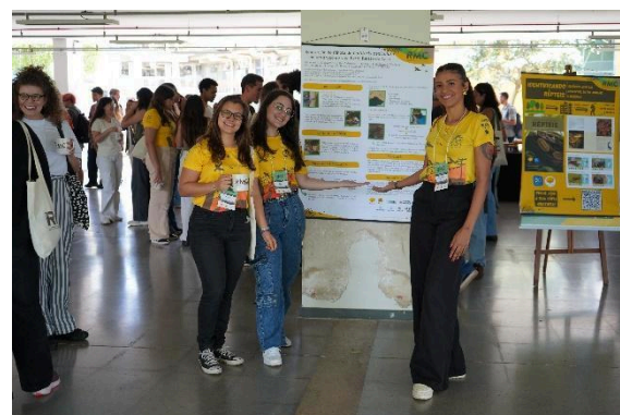
Apresentação de trabalho