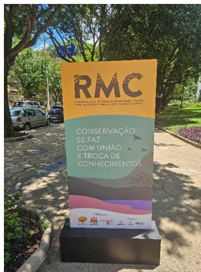
Entrada do evento RMC Data: 18/11/2024