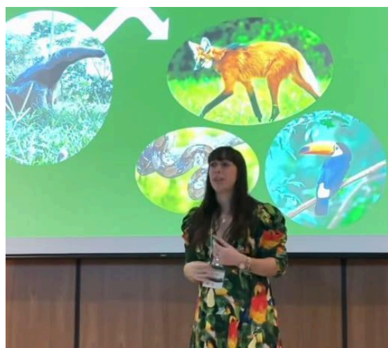
Palestra “Desafios Ambientais nas Translocações de Tamanduás-bandeira: o que aprendemos no Projeto TamanduASAS?” Autoria: Instituto Waita Data: 19/11/2024