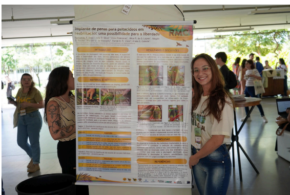
Apresentação de trabalho

Posteriormente, todos se dirigiram ao coffee break e, depois, iniciaram as apresentações de trabalho. A equipe pôde percorrer o espaço visualizando os trabalhos sobre as diversas temáticas apresentados, sobretudo alguns oriundos de projetos monitorados via Semente, com destaque para: Bicho Solto – de volta à natureza ; SOS SILVESTRES - Resgate de animais silvestres e Projeto Voar – desenvolvimento de técnicas para o retorno à natureza do psitacídeo mais capturado do mundo, o papagaio-verdadeiro (Amazona aestiva) .