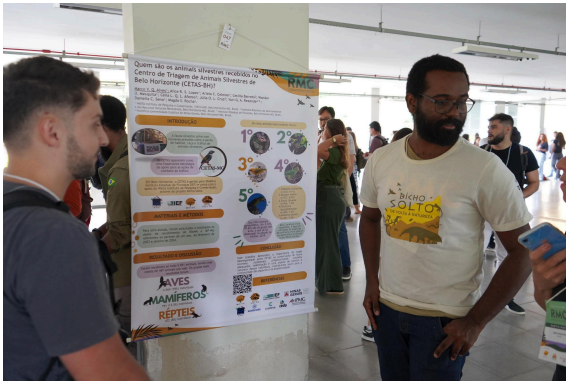
Apresentação de trabalho Autoria: Francisco Luz Data: 19/11/2024