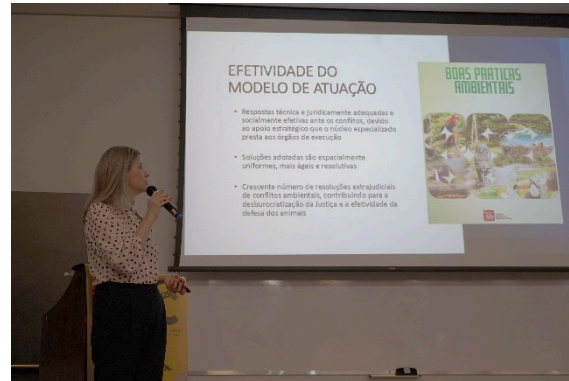
Palestra “Repercussões jurídicas do tráfico de animais”