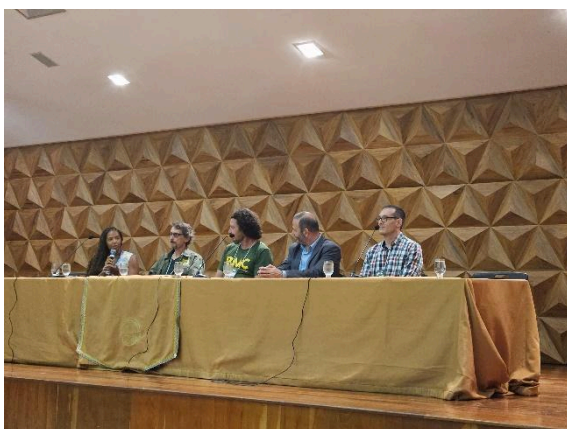
Mesa de abertura RMC Autoria: Carolina Rodrigues Bordignon Data: 18/11/2024