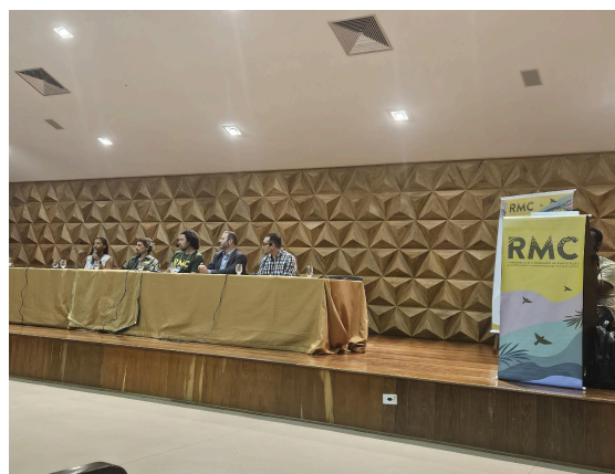
Mesa de abertura RMC Data: 18/11/2024

No dia 19, a equipe retornou à UFMG para acompanhamento da manhã do evento. Das 8h30 às 9h30 a equipe acompanhou duas das palestras simultâneas: “Desafios Ambientais nas Translocações de Tamanduás-bandeira: o que aprendemos