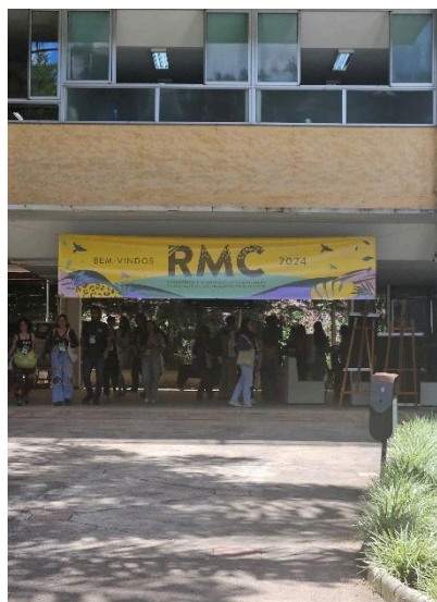
Entrada do evento RMC Autoria: Carolina Rodrigues Bordignon Data: 18/11/2024

argentina e outra estadunidense, mas a equipe do Semente não acompanhou o evento. A programação completa pode ser acessada no link: https://even3.blob.core.windows.net/intranet/documentos/RMC_2024_Programacao2.74b1f6cf181f401f9470.pdf