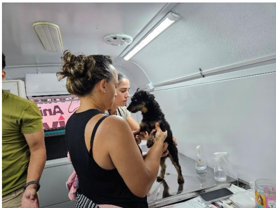
Foto 5. Consulta e anamnese Data: 28/03/2026

Então, os atendimentos são realizados por ordem de chegada e cada tutor com seu respectivo animal é chamado para iniciar a consulta no interior da unidade móvel. O atendimento é iniciado com a pesagem do animal e anamnese, com as médicas veterinárias realizando perguntas sobre histórico de saúde, rotina do animal e se há alguma queixa que levou à consulta. Para todos os animais é realizada a coleta de sangue para realização de hemograma. O material biológico é armazenado e enviado para laboratório especializado e o resultado fica pronto em aproximadamente três dias úteis. Então, após os resultados dos exames estarem disponíveis, a equipe envia para os tutores, juntamente com explicação sobre as eventuais alterações encontradas e as recomendações. Ainda, durante a consulta, para todos os animais saudáveis que não são vacinados, é aplicada a vacina V8 para cães e V4 para gatos, que os protege de diversas doenças. As carteiras de vacinação são entregues ao tutor. Todos os animais recebem uma coleira “Scalibor”, que oferece proteção prolongada contra carrapatos, pulgas e o mosquito transmissor da leishmaniose. Ainda, os tutores de cães recebem medicamento antiparasitário para ser administrado em casa (Fotos 5 a 12).