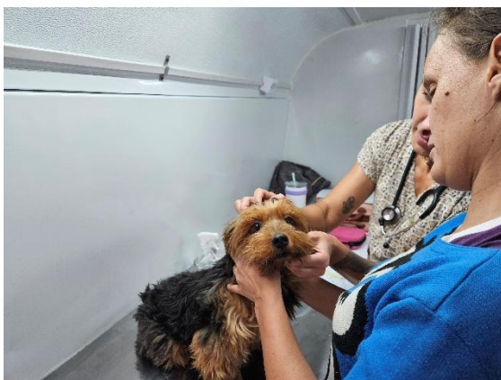
Foto 7. Consulta e anamnese