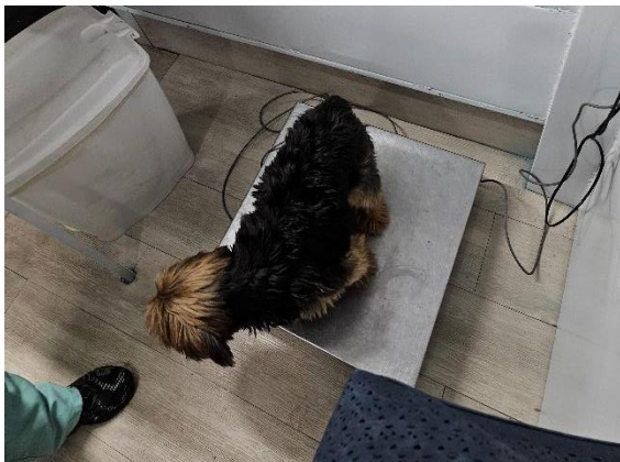
Foto 9. Pesagem do animal Data: 28/03/2026