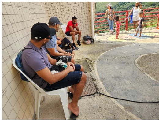
Foto 3. Tutores aguardando atendimento Data: 28/03/2026