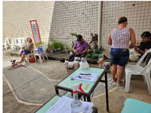
Foto 2. Tutores aguardando atendimento Data: 28/03/2026