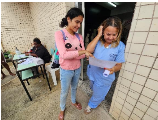
Foto 13. Orientações a tutores Data: 28/03/2026

(Foto 13). Ainda, os tutores têm o canal de comunicação via WhatsApp para sanar alguma dúvida que tenha ficado ao longo da consulta.