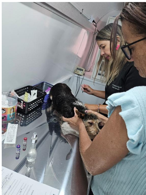
Foto 11. Aplicação de vacina Data: 28/03/2026