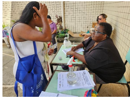
Foto 4. Conferência de cadastro e preenchimento de ficha Data: 28/03/2026