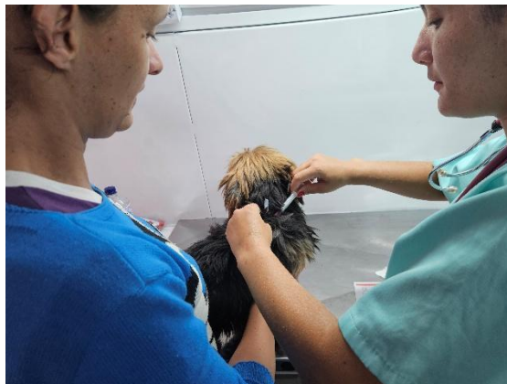
Foto 10. Coleta de sangue Data: 28/03/2026