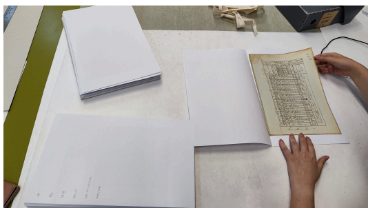
Documento diagnosticado, higienizado e com novo acondicionamento Autoria: Francielle Ferreira Data: 31/03/2026

O projeto consiste na realização de diagnóstico do estado de conservação dos documentos que compõem a subsérie 16, a subsérie 17 e a subsérie 18 da série 1 do fundo Presidência da Província de Minas Gerais (1821-1889). São cerca de 500 caixas, nas quais estão sendo realizados levantamento de serviços necessários para futuras intervenções de restauração. Os procedimentos adotados passam por higienização, substituição de acondicionamento e preparação técnica da documentação, que consiste em numeração de páginas e identificação da documentação necessária para futuras ações de reformatação da documentação.